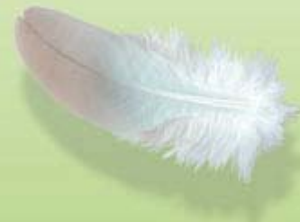
Layout: Informationscentrum, Landstinget i Östergötland Produktion: Kisatryckeriet februari 2006